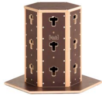
Wabe klein 427,73 €