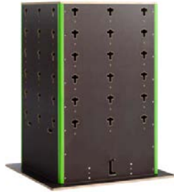
Cube klein 1500,00 €