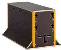
Wall klein 1091,60 €