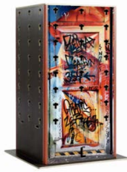
Cube rock 2234,45 €