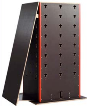
Schrägwand groß 368,91 €