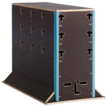
Wall groß 1175,63 €