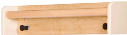
Multi-Adapter 192,44 €

MA wie die Verbindungselemente in den T-Öffnungen fixieren. Der MA wird für die Befestigung folgender Zusatzelemente benötigt: