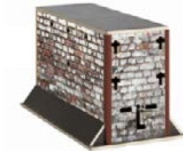
Wall timber 1242,86 €