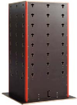
Cube groß 1629,41 €