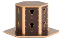
Wabe mini 371,32 €