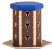
Polsterdeckel klein 175,63 €