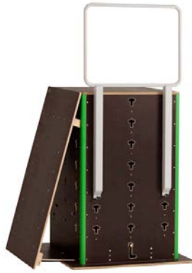
Schrägwand klein 343,70 €