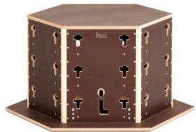
Wabe groß 1175,63 €