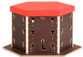
Polsterdeckel 259,66 €