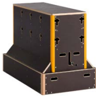
Untersetzer 209,24 €