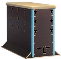
Polsterdeckel 326,89 €